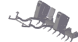
Escarificador trasero o ripper